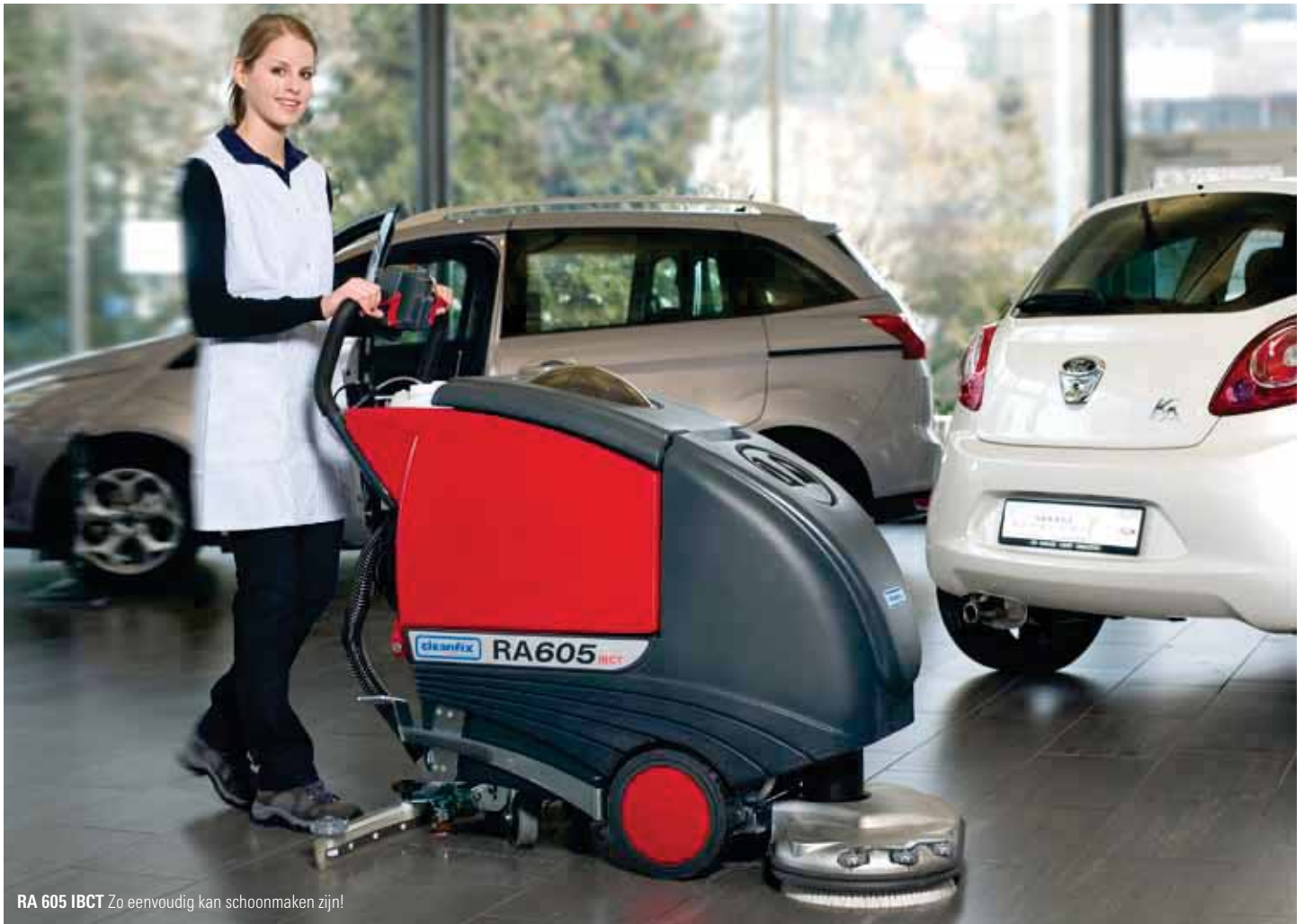
RA 605 IBCT Zo eenvoudig kan schoonmaken zijn!