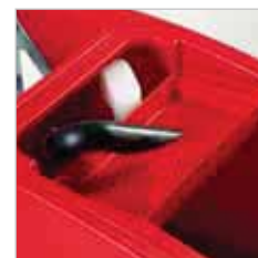
RA 505 IBC / RA 505 IBCT / RA 605 IBCT Het grofvuilfilter vangt alle grote vervuilingen op. Het is eenvoudig te schoon te maken.