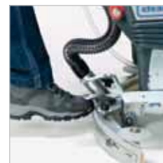
RA 505 IBC / RA 505 IBCT / RA 605 IBCT De zuigmond is effectief te bedienen met de voet.