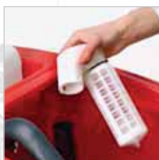
RA 505 IBC / RA 505 IBCT / RA 605 IBCT De vlotter / filter kan uit de machine worden genomen en gereinigd worden. Het functioneert tevens als overloopbescherming.