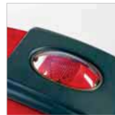
RA 505 IBC / RA 505 IBCT / RA 605 IBCT Het venster zorgt voor een goed overzicht over wat er in de vuilwatertank gebeurt.