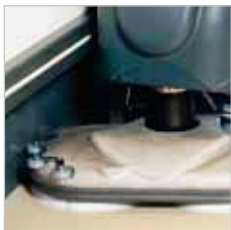
RA 605 IBCT Borstelkop staat licht zijdelings waardoor er ook onder bijv. stellingen gereinigd kan worden. Hoogte borstelkop: = 10 cm