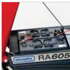
RA 505 IBCT / RA 605 IBCT Batterijen zijn eenvoudig te bereiken. Dit geldt ook voor de zekeringen voor de zuig- en borstelmotor en de aandrijving.