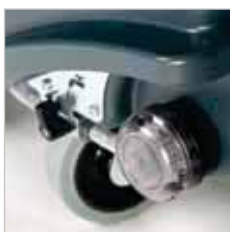
RA 505 IBC Eenvoudig toegankelijk schoonwaterfilter en traploos verstelbare waterdosering.