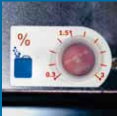
Optie: Eenvoudig instelbare reinigingsmiddeldosering.