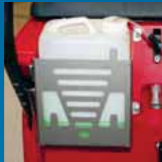
Houder voor 5 liter can.