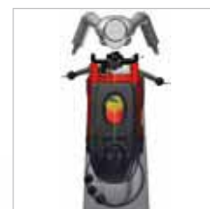
RA 505 IBC / RA 505 IBCT / RA 605 IBCT De afgeronde vorm aan de voorzijde zorgt ervoor dat men goed zicht heeft op de schrobborstel(s).