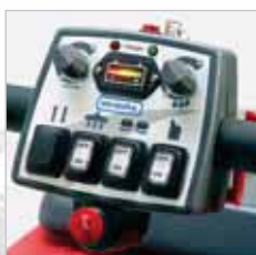
RA 505 IBCT / RA 605 IBCT Overzichtelijk ontworpen bedieningspaneel.