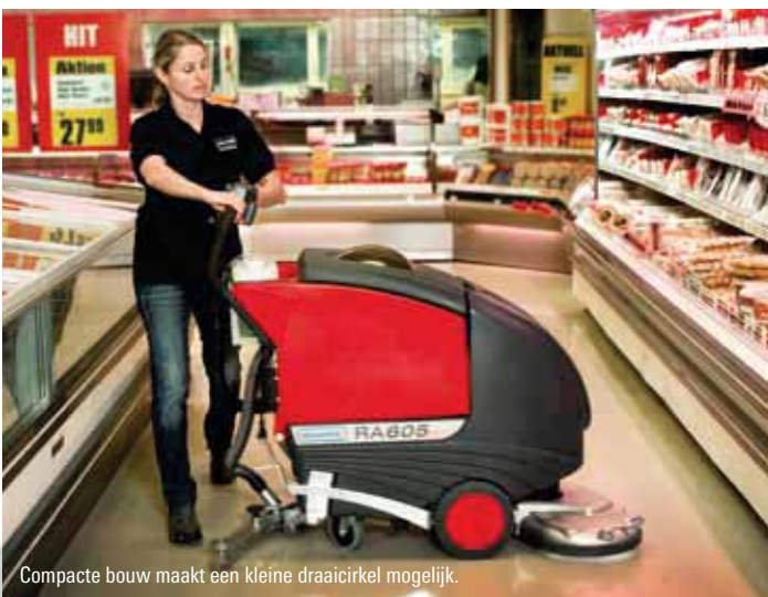
Compacte bouw maakt een kleine draaicirkel mogelijk.

De RA 605 IBCT is met 2 schrobborstels uitgevoerd (2 x Ø 318 mm) = een werkbreedte van 62 cm. De machine is tractiemotor aangedreven én heeft een snelheidsafhankelijke vloeistofdosing. Ook voor deze machine is het Cleanfix Advanced Dosing System (CADS) optioneel verkrijgbaar. De RA 605 IBCT is geschikt voor middelgrote oppervlakken met max. 8% helling.