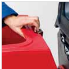
RA 505 IBC / RA 505 IBCT / RA 605 IBCT De machines zijn eenvoudig te openen. De batterijen zijn goed te bereiken.