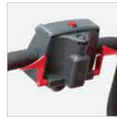
RA 505 IBC / RA 505 IBCT / RA 605 IBCT Het veiligheidshandvat is zo gemaakt dat de machine zonder gebruiker nooit kan gaan rijden. Bij de RA 505 IBCT / RA 605 IBCT wordt met dit handvat de snelheid bepaald.