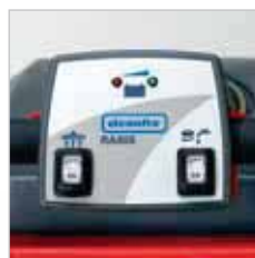
RA 505 IBC Zeer duidelijk bedieningspaneel.