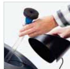
RA 505 IBC / RA 505 IBCT / RA 605 IBCT Met de optioneel verkrijgbare vulslang kan men de schoonwatertank gemakkelijk vullen.