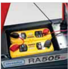
RA 505 IBC Batterijgedeelte en zekeringen voor zuig- en borstelmotor zijn makkelijk toegankelijk.