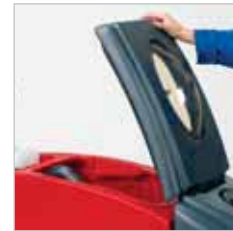
RA 505 IBC / RA 505 IBCT / RA 605 IBCT Door de grote opening is de vuilwatertank eenvoudig te reinigen.