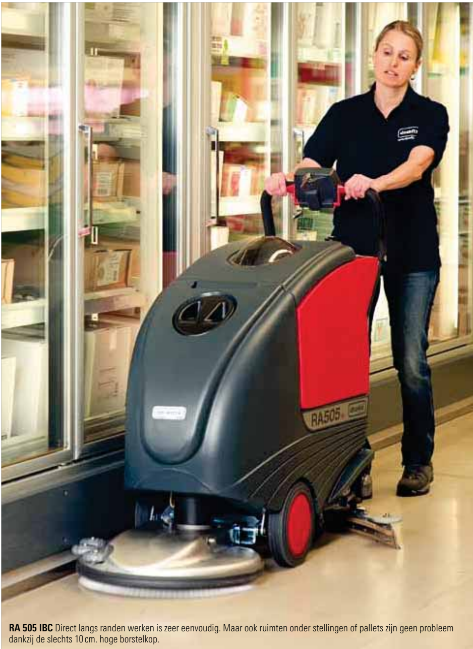
RA 505 IBC Direct langs randen werken is zeer eenvoudig. Maar ook ruimten onder stellingen of pallets zijn geen probleem dankzij de slechts 10 cm. hoge borstelkop.