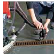
RA 505 IBC / RA 505 IBCT / RA 605 IBCT U kunt het vuile water gedoseerd afvoeren met de flexibele afvoerslang.