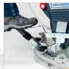
RA 505 IBC / RA 505 IBCT / RA 605 IBCT De zuigmond en borstel(s) zijn eenvoudig met de voet te bedienen.