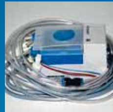
Cleanfix Advanced Dosing System.