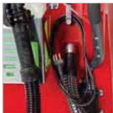
RA 505 IBC / RA 505 IBCT / RA 605 IBCT Na gedane arbeid hoeft men slechts de netsnoer in het stopcontact te steken om de batterijen op te laden. Het laadapparaat is geïntegreerd in de machine.